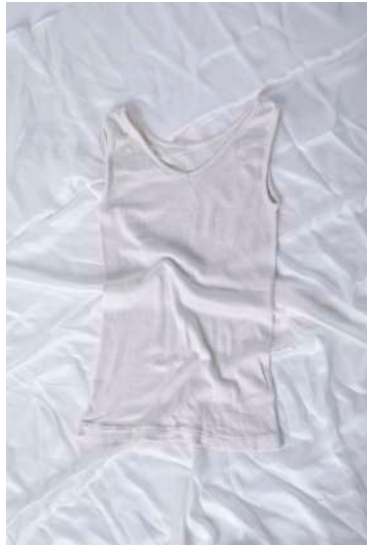
091021-05//SILK 2WAY TANK TOPS

Price 13800+tax SIZE ONE COLOR NUDE BLACK QTY WashableSilk100% MADE IN JAPAN 3月