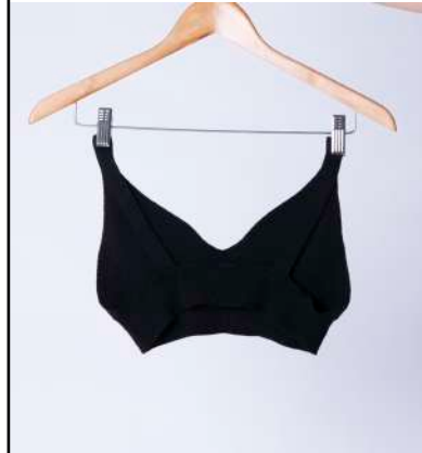
091021-09 //SILK BRA

お腹とお尻をすっぽりと包み暖めるスタイリッシュな腹巻きレギンス。ウエスト部分を折り返しても着用できるので、もたつき知らず。余分な熱は放射するので夏場も爽やかに暖めてくれます。