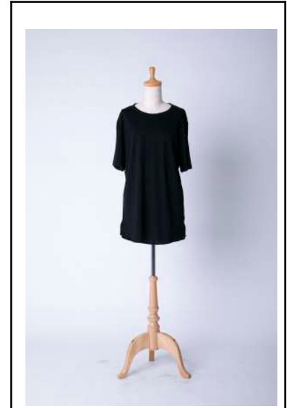
091021-04//SILK UNISEX T-shirts

Price 29000+tax SIZE ONE COLOR NUDE CHACOLE GRAY LAVENDER QTY WashableSilk100% MADE IN JAPAN 1月