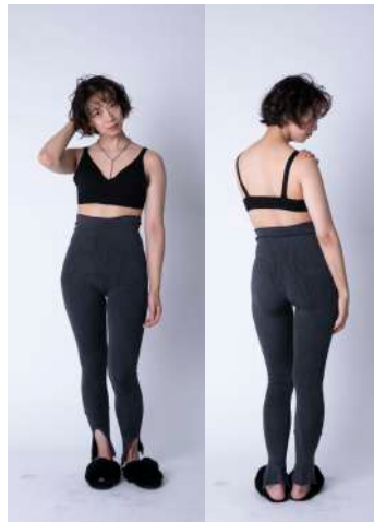
091021-08 //SILK BELLY BAND LEGGINGS

Price 15000+tax SIZE 0 / 1 COLOR NUDE CHACOLE GRAY BLACK QTY WashableSilk100% MADE IN JAPAN 1月