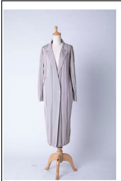
091021-01// SILK LONG CARDE JACKET

Price 33000+tax SIZE ONE COLOR NUDE CHACOLE GRAY LAVENDER QTY WashableSilk100% MADE IN JAPAN 1月~