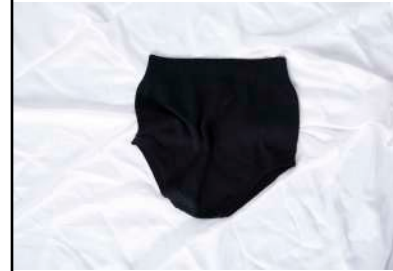
091021-10 //SILK BELLY BAND SHORTS

バストを優しく包み、保湿するシルクブラ。意外と乾燥しやすいバストは放っておくと小じわや垂れる原因に。心地よいホールド感を残しながら保湿してくれる優しいブラ。パット取り外し可