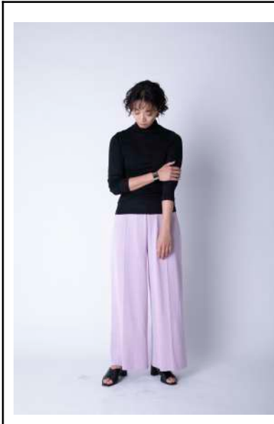
091021-03 //SILK CENTER LINE PANTS

Price 28000+tax SIZE ONE COLOR NUDE CHACOLE GRAY LAVENDER QTY WashableSilk100% MADE IN JAPAN 1月