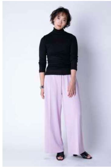
091021-06//SILK TURTLE NECK TEE

Price 13800+tax SIZE ONE COLOR NUDE BLACK QTY WashableSilk100% MADE IN JAPAN 3月