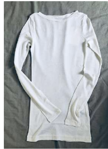
091021-07//SILK BOAT NECK TEE

Price 23000+tax SIZE ONE COLOR NUDE BLACK QTY WashableSilk100% MADE IN JAPAN 2月