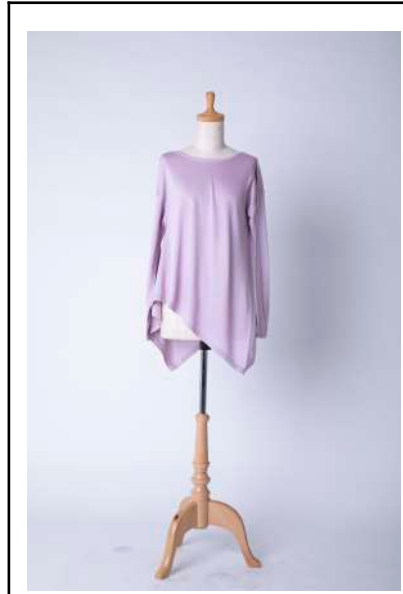
091021-02 //SILK ASYMMETRY 2WAY TOPS

Price 33000+tax SIZE ONE COLOR NUDE CHACOLE GRAY LAVENDER QTY WashableSilk100% MADE IN JAPAN 1月~