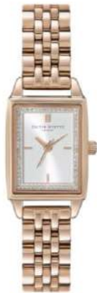
24000014 Carnation Gold