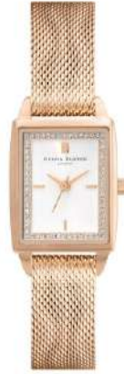
24000015 Carnation Gold