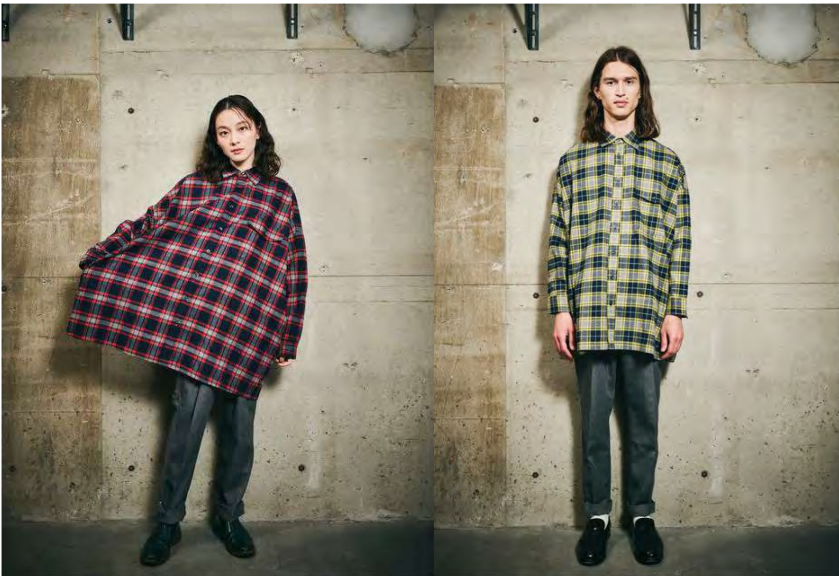
両脇にポケット付き