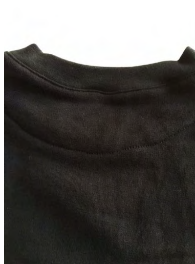
襟裏折返仕様で補強