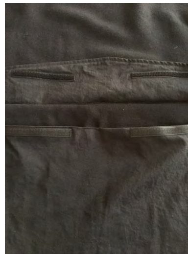
カンガルーポケット上部