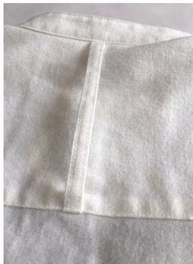
ヨークはフックループ仕様