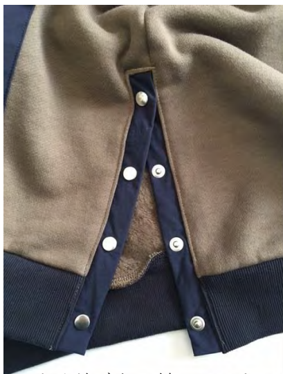
サイドボタン付スリット