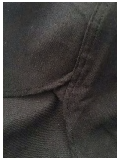
ガゼットでサイド補強