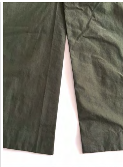
深いセンターベント