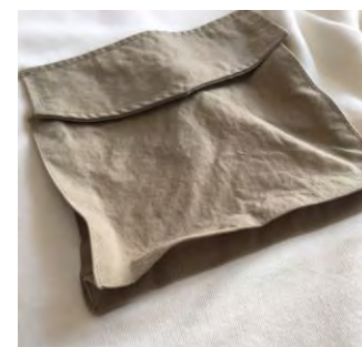
マチあり立体ポケット