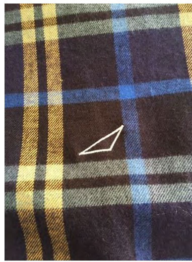
ブランドロゴ刺繍