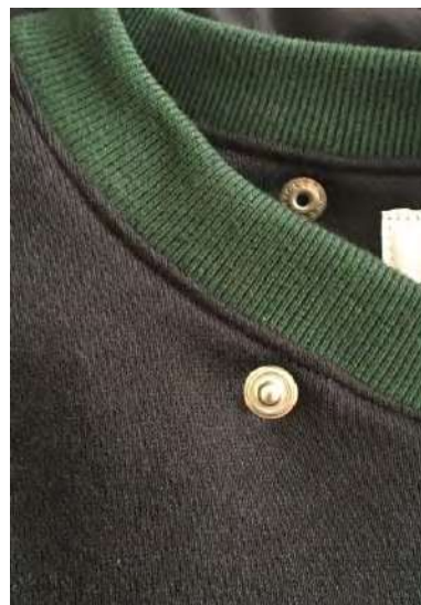
フードデタッチャブル