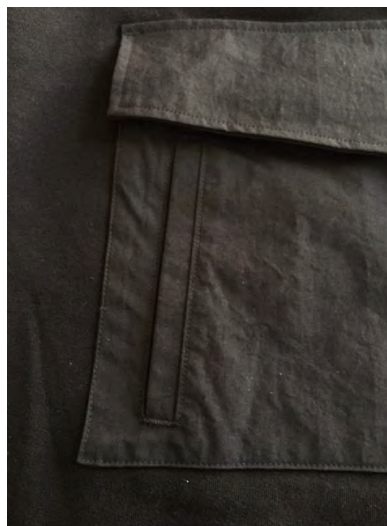
カンガルーポケットサイド