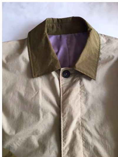
補色の裏地 パープル