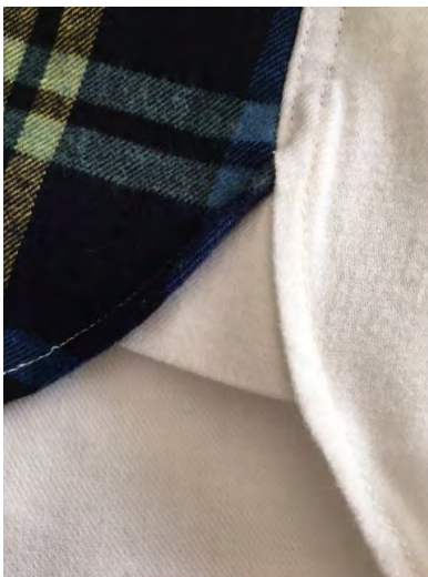
ガゼットでサイド補強