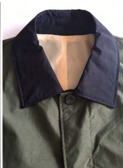
補色の裏地 イエロー