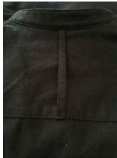
ヨークはフックループ仕様